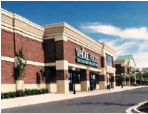
Ilustración 1- Whole Foods

Grandes cadenas de supermercados se han especializado en la venta al detalle de productos orgánicos, como por ejemplo Whole Foods , Wild Oast y el más accesible Trader Joes , que pertenece a la empresa Alemana Aldi.